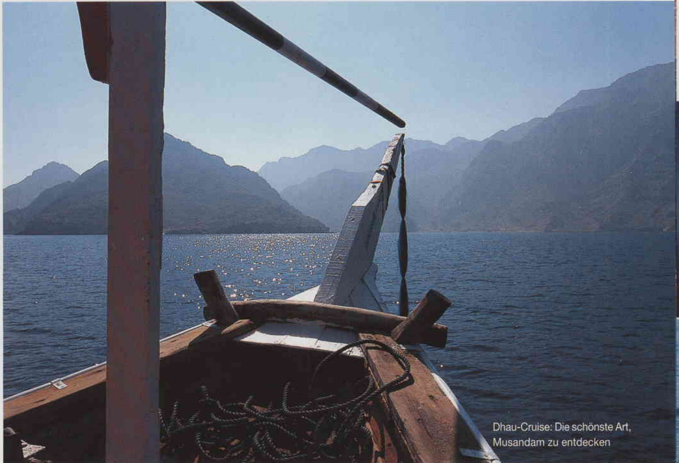
Dhau-Cruise: Die schönste Art, Musandam zu entdecken

Zwei Tage an Bord einer traditionellen Dhau zeigen den ganzen Zauber der schroff-schönen Fjordlandschaft auf der Halbinsel Musandam.