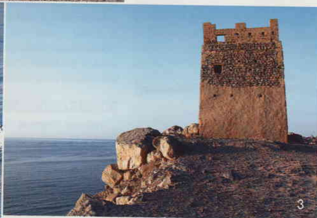
1 Khor Najd: Steile Serpentinien führen zum einzigen per Pkw erreichbaren Fjord 2 Delfine: Bei Cruises stets dabei 3 Al-Khasab: Alter Wachturm bei der Hauptstadt

tor vor sich hin. Das Boot gleitet ruhig durch die tiefen Fjorde. In den steilen Felswänden nisten unzählige Kormorane. Riesige Schwärme von Möwen lassen sich auf dem Wasser dahintreiben und erheben sich dann urplötzlich auf ein geheimes Kommando hin in einer laut kreischenden Wolke in die Luft.